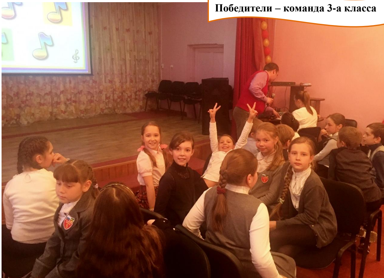
Победители – команда 3-а класса