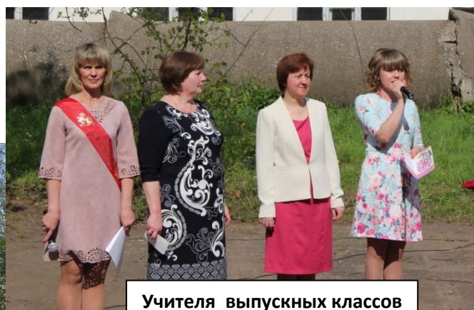
Учителя выпускных классов