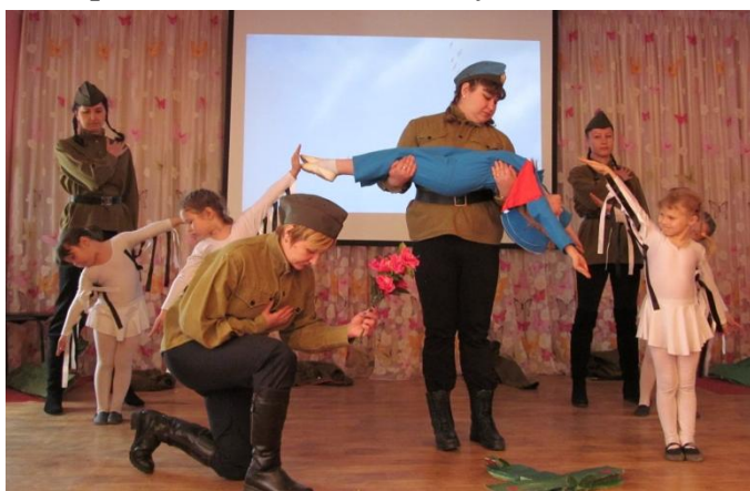
Воспитанники детского сада №14 инсценировали вместе со своими педагогами песни военных лет.

Оба встретили войну совсем юными, но внесли свой посильный вклад в дело Победы. И теперь делятся с учениками воспоминаниями и наставляют. Потому день рождения школьного музея любят и помнят наравне с Днём Победы.